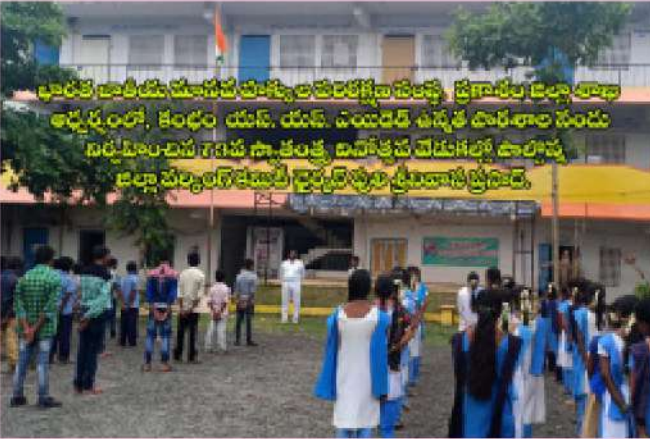
ప్రారంభ బాలికలు మాసపహాకులపరిరక్షణ కార్యక్రమ ప్రారంభం జరిపి ఆహార పదార్థాలను గానన సామగ్రితో పాటు పాఠ్యపుస్తకాలను పంపిణీ చేసింది. ఈ సందర్భంగా పాఠ్యపుస్తకాలను పంపిణీ చేసిన దివ్య దీపారాధనను ప్రారంభించి అధ్యక్షులు ఆ కార్యక్రమం ప్రారంభించారు.