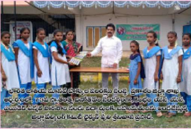
ప్రారంభ బాలికలు మాసపహాకులపరిరక్షణ కార్యక్రమ ప్రారంభం జరిపి ఆహార పదార్థాలను గానన సామగ్రితో పాటు పాఠ్యపుస్తకాలను పంపిణీ చేసింది. ఈ సందర్భంగా పాఠ్యపుస్తకాలను పంపిణీ చేసిన దివ్య దీపారాధనను ప్రారంభించి అధ్యక్షులు ఆ కార్యక్రమం ప్రారంభించారు.